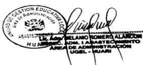
(Presidente) Miembro Alterno